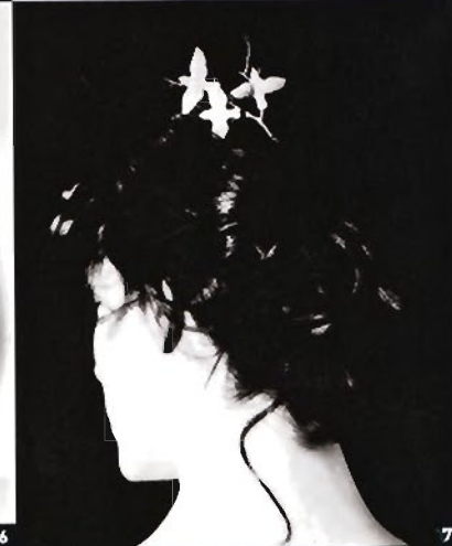
POESIE WIRD FORM 1 Porzellan-Elfen schweben von der Decke: der „Niagara“-Leuchter für Lladró 2 Streng grafisches Sperlein-Dekor, inspiriert von der Natur: „Black Forest“ auf Bone-China-Porzellan von Dibbern 3 Kraftvoll revitalisiert: der Hahnenkopf, ursprünglich Teil einer Lladró-Figur, hier paarweise als origineller Salz- und Pfefferstreuer „Gallus“ 4 „Botanic Table Light“ aus der Bodo Sperlein Collection: apart durch die Kombination eines Hightech-Laborglases mit handgefertigten Porzellanblüten 5 Einzelelemente aus der „Talismania“-Schmuckkollektion von Lladró wurden hier zum Wandvorhang „Ouverture“ neu zusammenmontiert 6 Bone China aus der Bodo Sperlein Collection „White Dots“: Windlicht „Candle Beaker“, Vasen „Cylinder“, „Boa“ 7 Porzellanhaarspange von Lladró